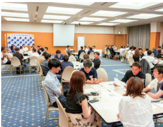
▲グループワークの様子

第二部では、各グループに分かれ、 「わたしたちのウェルビーイングカー ド」を使い、個々が大切にしている価値 観や自分自身、経営者にとってのウェル ビーイングとは何かを考えました。