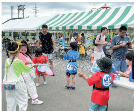
▲バブルガンで遊ぶ子供たち

ルすることができました。また、行政で ある越前市との繋がりもより強固なも のになり、今後の武生YEG活動への 理解を深められる機会となりました。