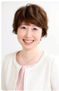
日本メンタルアップ 支援機構

実際に、若い世代からの声を聞く「もっと指摘してほしい」「ダメなら注意してほしい」という成長につながる声掛けを欲していることを感じます。遠慮して言わないと部下は「成長が見込めない」と思われている。「期待されていない」「ここでは成長できない」とネガティブに捉えてしまうのです。言うべきことは、はっきりと具体的な理由を明示することで、こちらの意向や真意を受け取ってもらいやすくなります。ぜひ、遠慮せずに言いたいことを伝えていきましょう。