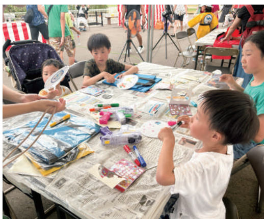
▲はっぴ・うちわ作り体験の様子