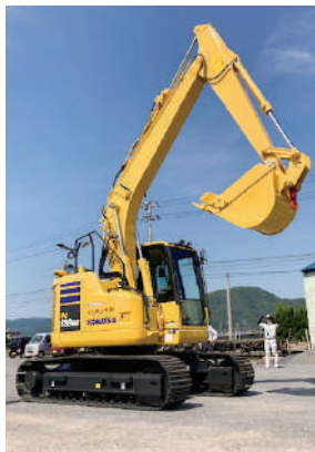
▲建設会社の仕事は必然的に屋外がメインとなる。

建設業のイメージを払拭！ 読者の皆様は、「建設業で働く」といふこのイメージをどうお持ちだろうか？「建設業界イメージ調査」(*)によると、建設業界従事者からのマイナスイメージとして「若い人材が少ない」、「残業・休日出勤が多い」、「清潔感がない」がトップ3を占めた。一方、大学生からは「残業・休日出勤が多い」、「給料が低い」、「清潔感がない」が並び、共に働き方や待遇にネガティブなイメージがあるようだ。